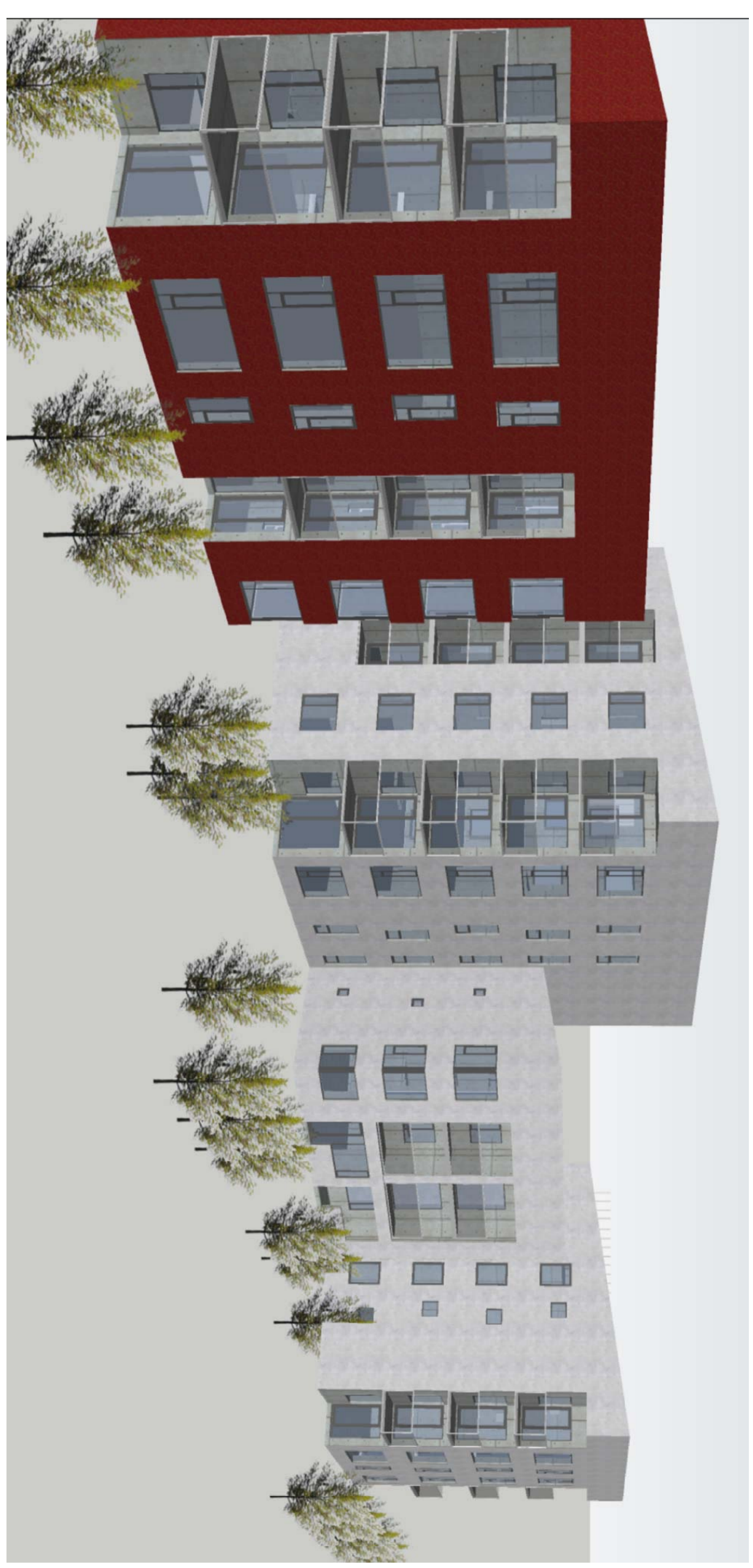
ÚTLITSHUGMYND - SUBUR