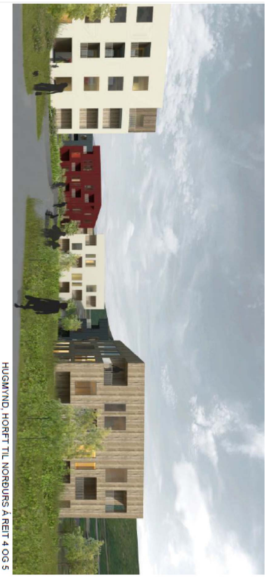
MYND ÚR SKILMÁLUM DEILISKIPULAGS

Apalskarð 2-4 eru fjölbýli merkt F9 og F10 á upprætti og eru hluti af íbúðarbyggingum á reit 4. Húsin eru alm. 3. og 4.hæða, en Apalskarð 4 er að hluta 5 hæðir. Apalskarð 2 er staksrætt en húsn. 4 eru 3 einingar með samtals 22 íbúðum. Bilgeymsla og alm. geymslur neðanjarðar tengja húsin saman. Megináskoma er að húsum norðanvegin frá Apalskarði. Þar eru bílastæði og innkeisla að bílageymslu í kjallara. Bílastæði á lóð eru upb. 50 en í bílakjallara upb. 27 stæði, samtals 76-77 stæði. Einingarnar (F9 og F10) eru tyrirugaðar "samþærlegar" í útliti. Innra skipulag og form íbúða endurspeglar markmið í deiliskipulagi og ólíka stærð íbúðaeininga. Leitast er við að "alrymi" snúi að útsýnsáttum og að svalfr séu á tilhornum íbúða. Við hönnun lóðar og landmótun verður tekið mið af væntingum í skilmálum. Yfirborð bílastæða verður að hluta brotið upp með heilvögn og grasseini í sem og trjágróðri. Efnisval og yfri áferð bygginganna tekur mið af skilmálum. Fyrirhugað er að staðsteypa húsin og fylla eða stena útveggi. Þyngingar verða á völdum stöðum td. við gluggaflöt. Inngangar eru "indregni".