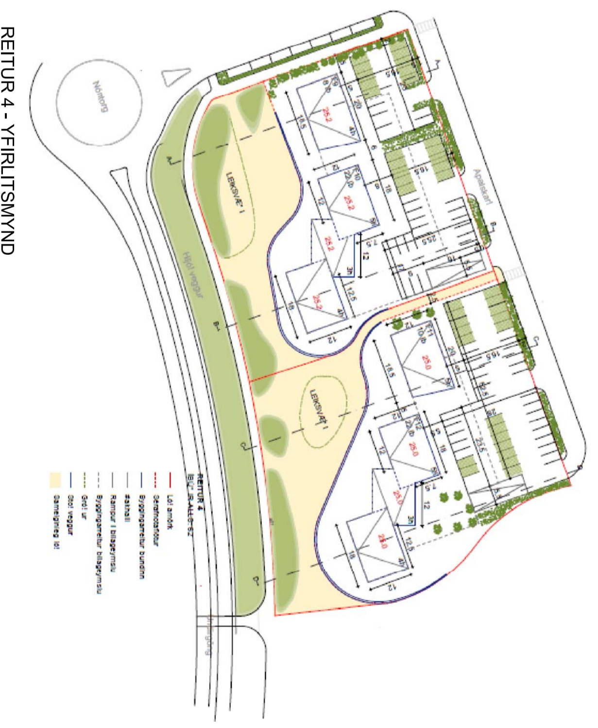
REITUR 4 - YFIRLITSMYND